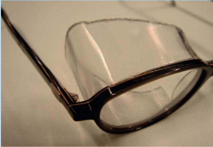
Abb. 2: „Feuchte Kammer“ vor der Anpassung.