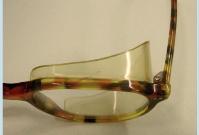
Abb. 3: „Feuchte Kammer“ nach der individuellen Anpassung.

unsichtbar. Sollte sich nach einer gewissen Zeit eine andere Refraktion einstellen, ist die angepasste „Feuchte Kammer“ immer wieder neu verglasbar.